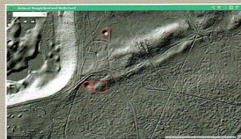
Afb.5. Beeld van het deel van de Lange Heul waar de boerderij heeft gestaan. De kuilen binnen de rode cirkeltjes zijn de restanten van waterputten. Binnen het rode kadertje heeft de boerderij gestaan.