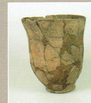
Afb.6. Deze Standvoetbeker dateert van de periode 2850-2200 v. Chr. en is in 1938 gevonden in het opgravingsvlak van de boerderij, maar is afkomstig uit een oudere grafheuvel.