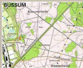
Afb.2. Topografische kaart van 2011, met een X is de locatie van de opgegraven boerderijplaats aangegeven.